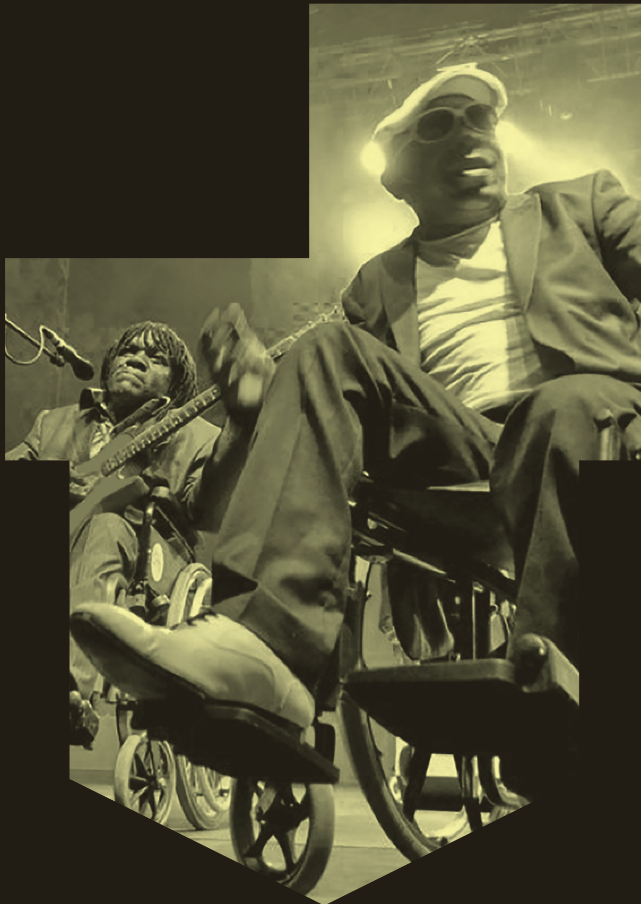
Staff Benda Bilili (2012).